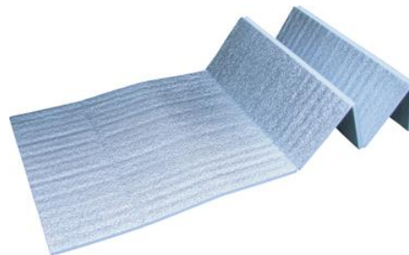
巻き癖の無いフラットな使用感！