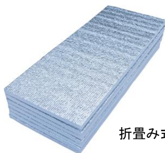
折畳み式で収納便利

グランドエイト・シリーズ や スリムジャバ・シリーズ のような折りたたみタイプは、折りたたんだ時に、地面に触れていた面どうしが重なりますので、安心です！