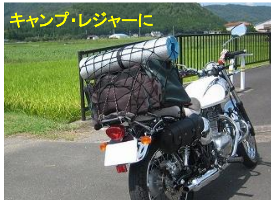
キャンプ・レジャーに